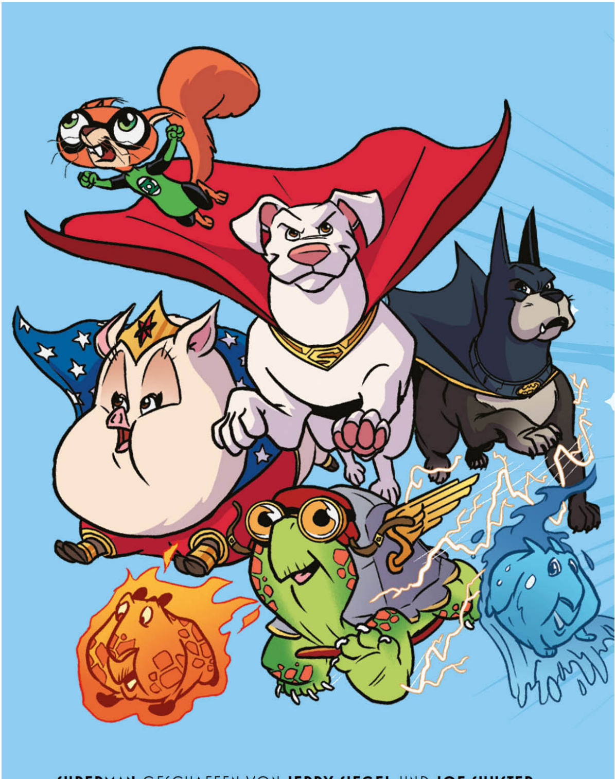
SUPERMAN GESCHAFFEN VON JERRY SIEGEL UND JOE SHUSTER . MIT BESONDERER GENEHMIGUNG DER JERRY SIEGEL-FAMILIE .