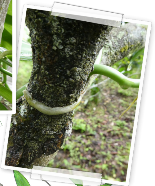
Luftwurzeln klammern sich am Baum fest Aerial roots cling to a tree