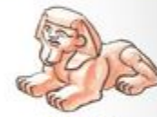
Sphinx [sprich: Sfinks]