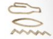
Hieroglyphen [sprich: Hirolglüfen]