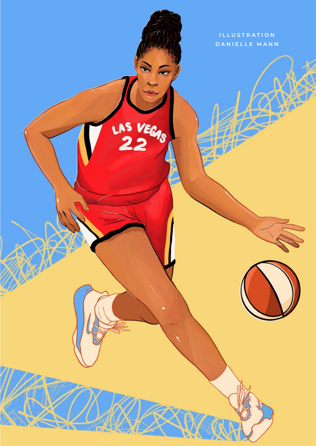
ILLUSTRATION DANIELLE MANN