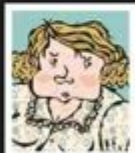
Pia Fenn-tax Fotografin