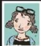
Ninhi Oljemärk Layout