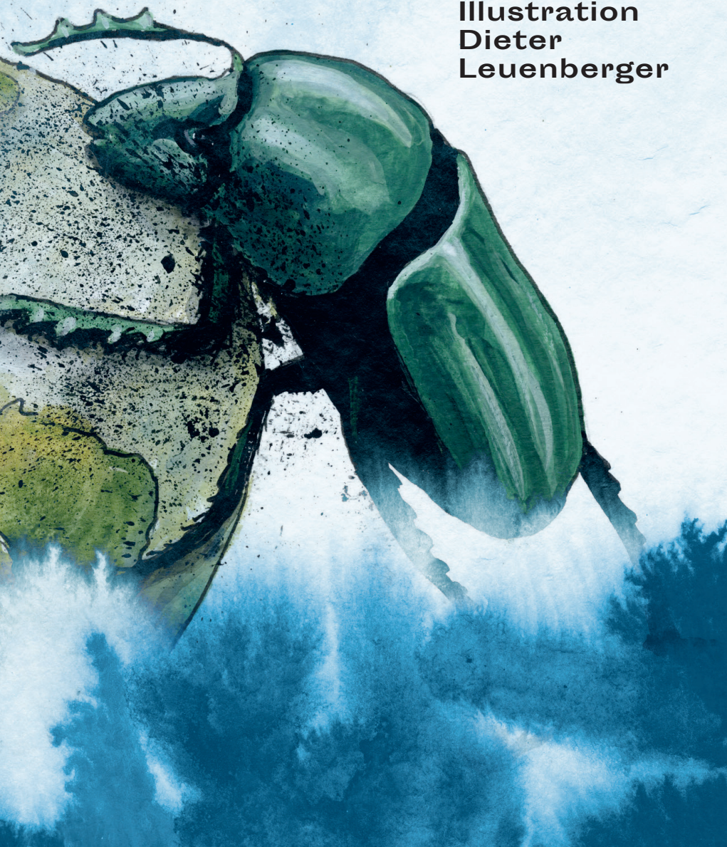
Illustration Dieter Leuenberger