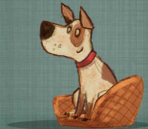
Illustration: David Hüttner