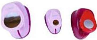
runde Motivstanzer in verschiedenen Größen