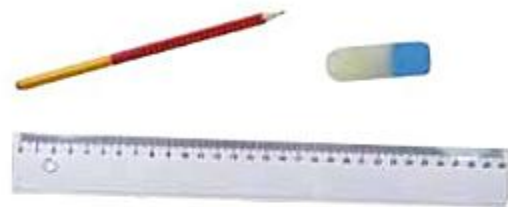
Bleistift, Radiergummi, Lineal