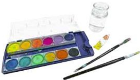
Wasserfarben, Malbecher mit Wasser und verschiedene Pinsel